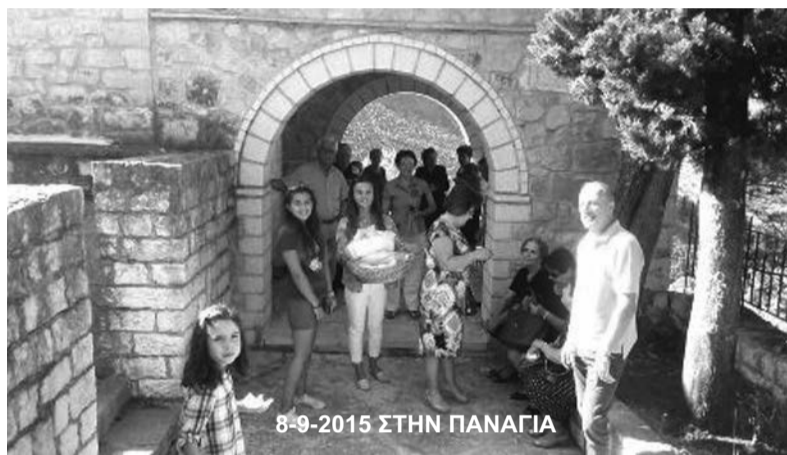
8-9-2015 ΣΤΗΝ ΠΑΝΑΓΙΑ

ποιήθηκε το καθιερωμένο πλέον νυκτερινό κολύμπι στην όμορφη και δροσιτική παραλία του «Δρεπάνου», όπου παραβρέθηκαν με τα ΙΧ αυτοκίνητά τους καμιά σαρανταριά Σιδερίτες και των δύο φύλων με κυρίαρχη τη νεολαία μας. Εκεί μεταφέρθηκε η ψησταριά του Συλλόγου και ψήθηκαν σουβλάκια και λουκάνικα, τα οποία, συνοδευμένα από αναψυκτικά κάθε λογής και μπίρες, προσφέρθηκαν δωρεάν από τον Σύλλογο. Επακολούθησε μικρό ντα-